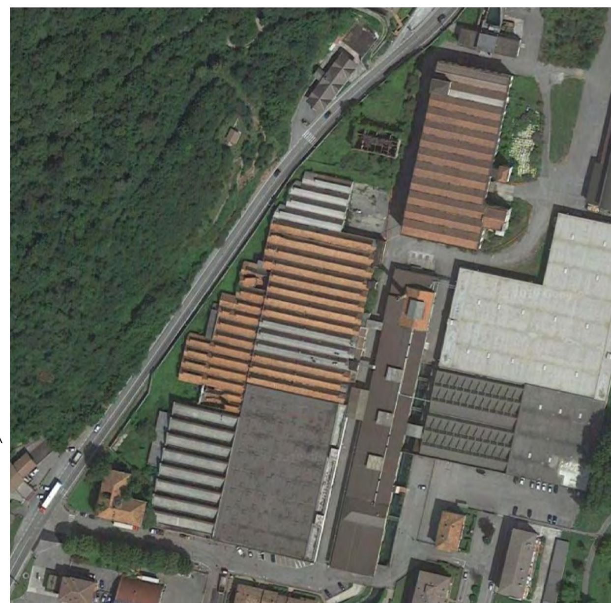
ESTRATTO GOOGLE MAPS